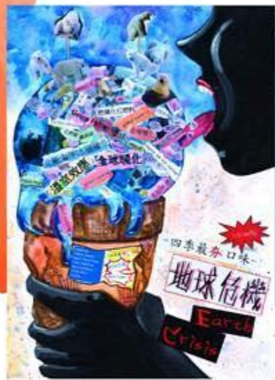
林子珊 - 四季尚夯口味 105學年度 臺北市學生美術比賽 平面設計類第三名

在此，謝謝古亭校長與老師們三年用心地指導，讓我有發光發熱的舞台，我會帶著您們的期許與愛在附中迎向更加燦爛的未來。