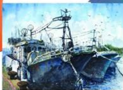
童昱華 - 泊 105學年度 臺北市學生美術比賽 西畫類第二名