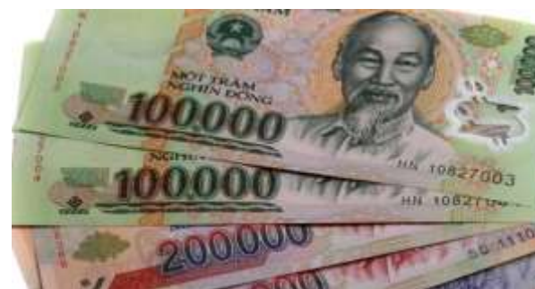
↑ 數字超大的越南盾，動不動就是十萬、二十萬

越南貨幣非常有趣！台幣的 1 塊錢相當於 700 多的越南盾。因此，正常情況下，你的一頓晚餐費用會是五萬到十萬越南盾，而你的住宿很可能超過一百萬越南盾！如此大量的金錢常讓遊客感到非常困惑，所以同學若之後有機會到越南旅遊的話，要小心不要看錯 0 的數目，若你要付一萬元的東西而不小心給成十萬，越南商人可不會告訴你：你錯了！所以必須非常小心啊！