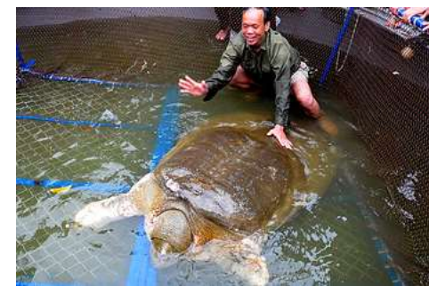
↑ 生活在越南首都河內還劍湖內的烏龜

另外，越南人非常喜愛烏龜。他們相信烏龜能帶來幸運和健康。他們仰慕龜的長壽，並相信在家裡養龜龜也會延長他們的生命。越南文化中有四種神聖的動物，烏龜便是其中之一。其他則是龍、鳳凰和獨角獸。